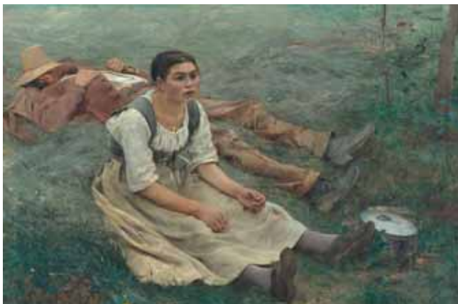
Jules Bastien-Lepage (1848–1884) Die Heuernte , 1877 180 x 195 cm, Öl/Leinwand

Der jährliche „Salon de Paris“ war im 19. Jahrhundert die weltweit wichtigste Kunstausstellung und das gesellschaftliche Ereignis schlechthin. Hunderttausende Besucher kamen, um das vielfältige Schaffen der damals bedeutendsten Künstler zu bewundern.